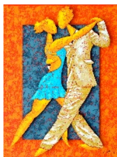
Les Attitudes de Brigitte Lambourg, jusqu'au 13 septembre